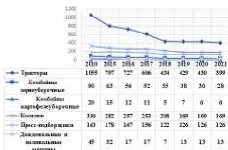
Рис. 1. Парк техники в сельскохозяйственных организациях