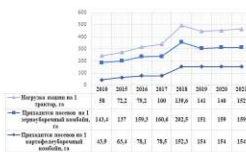
Рис. 2. Нагрузка на технические средства в сельскохозяйственных организациях