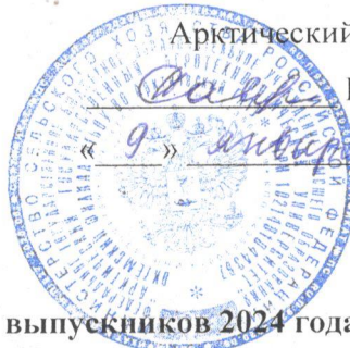
График проведения ГИА выпускников 2024 года