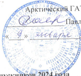
График проведения ГИА выпускников 2024 года