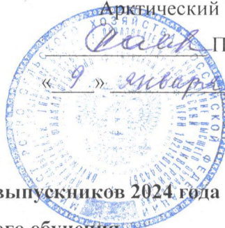
График проведения ГИА выпускников 2024 года