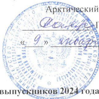
График проведения ГИА выпускников 2024 года