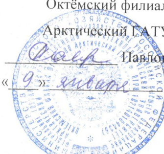
График проведения ГИА выпускников 2024 года