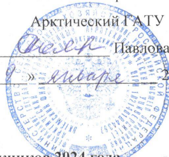
График проведения ГИА выпускников 2024 года